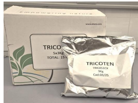
Figura 6. Tricoten, Atens®

Trichoderma atroviride AT10, pó molhável conidial, 5x10 9 UFC/g