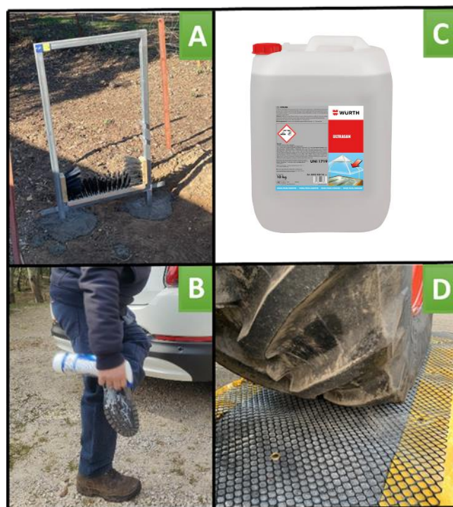
Figura 9. Estações de limpeza de calçado (A). Kits de limpeza móveis (B). Desinfetante líquido (Ultrasan, Grupo Würth) (C). Estações de limpeza de veículos (D).

As medidas enumeradas nos pontos (1) e (2) são eficazes em termos de custos, mas o êxito da sua aplicação depende da educação e da sensibilização das partes interessadas nas zonas afetadas.