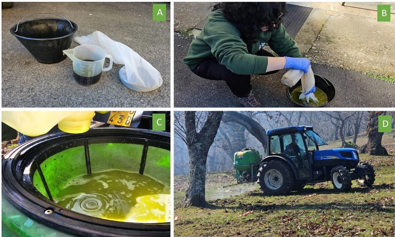
Figura 4. Preparação do Biofence FL. A) Misturar a solução líquida em 22 litros de água limpa e preparar os pellets , colocando-os no saco filtrante. B) Mergulhar o saco de filtro na mistura de água e solução líquida. Agitar vigorosamente para melhorar a infusão. C) Após 1 h, enxaguar o saco de filtro e adicionar a solução a um tanque de pulverização ou de fertilização com 1460 L de água.