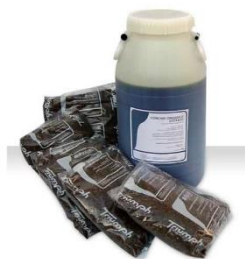
Figura 3. Biofence FL. 10 litros + 5 KG formato farinha.