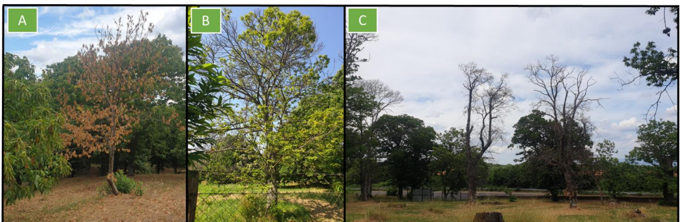
Figura 1. Árvore morta de forma súbita com folhas castanhas ainda na árvore (A). Redução da copa (B). Doença da tinta no castanheiro: mortalidade das árvores e degradação do ecossistema de um soto de castanheiros ( Castanea sativa ) na Itália (C).

O aparecimento desses sintomas corresponde a uma fase avançada da doença, quando a maior parte do sistema radicular já está comprometido (Vannini y Morales-Rodriguez, 2019) (Figura 1).