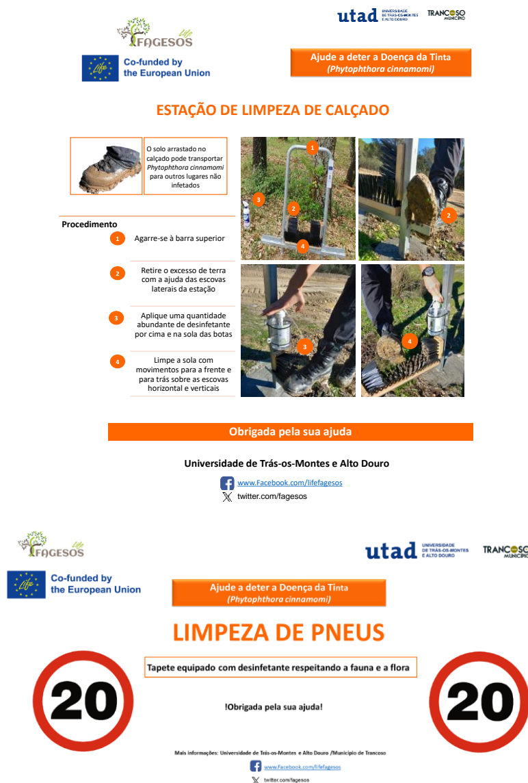
Figure 10. Sinalética para medidas de higiene e de sensibilização do público incluídas no protocolo. Exemplo de sinalética para o souto.