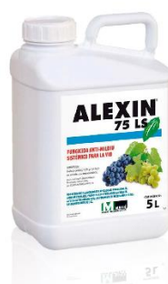
Figura 7. Alexin 75 LS, Comercial Química Massó

EUH401 Para evitar riscos para a saúde humana e para o ambiente, seguir as instruções de utilização.