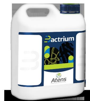
Figura 5. Bactrium, Atens®