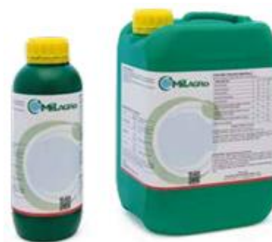
Figura 8. Kalex EVO®, Milagro International S.p.A.